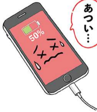
バッテリーのダメージに気を付けて、スマホを長持ちさせたいですね。