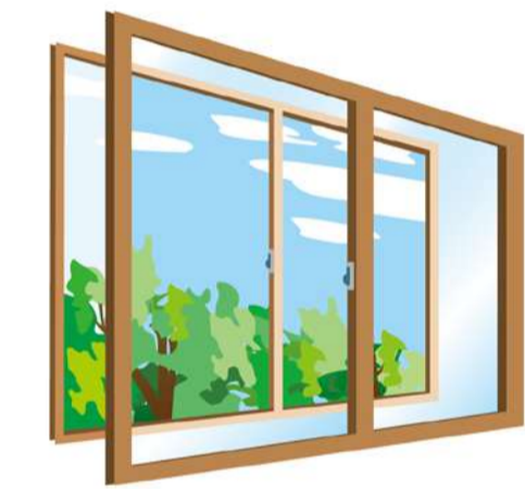
内窓の設置もおすすめ。窓を開けるのに時間を要します。

ことも手です。わずかなすき間にバールを入れてドアをこじ開ける手荒なやり口もあるので、鎌付きのデッドボルト（カンヌキ）タイプの鍵への交換もおすすめ。最新のドアは不正解錠しづらい構造のシリンドアや、鎌付きデッドボルトを採用したタイプもあるので、相談してはいかが？ 窓も対策が必要。洗面所やトイレなど、小窓でも換気以外は施錠を。リビング以外の部屋の窓、特に2階の