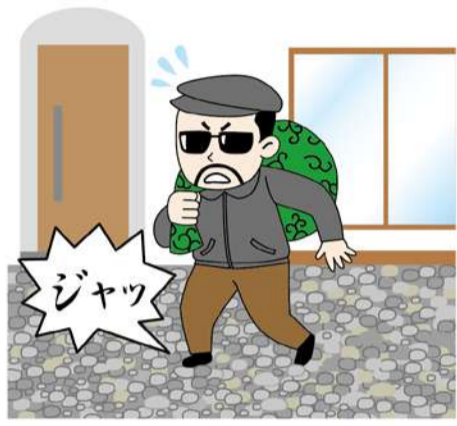
歩くとき大きな音がする防犯砂利というものもあります！建物の周辺に敷くと効果的です。

ことも手です。わずかなすき間にバールを入れてドアをこじ開ける手荒なやり口もあるので、鎌付きのデッドボルト（カンヌキ）タイプの鍵への交換もおすすめ。最新のドアは不正解錠しづらい構造のシリンドアや、鎌付きデッドボルトを採用したタイプもあるので、相談してはいかが？ 窓も対策が必要。洗面所やトイレなど、小窓でも換気以外は施錠を。リビング以外の部屋の窓、特に2階の