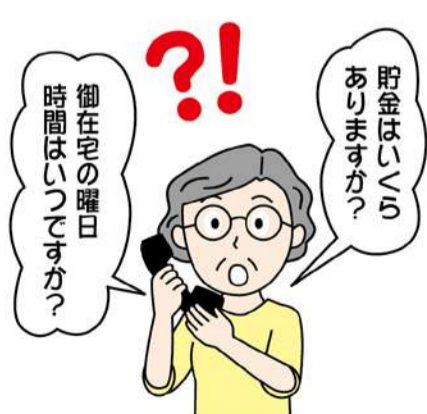
電話などで在宅状況や家族の状況、資産状況を聞かれてもむやみに答えないようにしましょう。

不意の訪問や電話 普段の行動にもご注意を！ 強盗は宅配業者や公共業者を装うなど巧妙化。対応する際には、必ずインターホンで事前確認を。また、たとえば「水道局の方から来ました。水道の確認をさせていただきます」というケースも。公共機関の業者には警戒感も薄くなりがち。そのような心理を巧みに利用してきます。そもそも